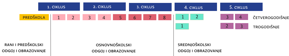
Slika B. Odgojno-obrazovni ciklusi u postojećoj strukturi do visokoškolskoga odgoja i obrazovanja (ONK, 2016.)

ONK-om su određeni i odgojno-obrazovni ciklusi koji obuhvaćaju nekoliko godina učenja i poučavanja, a usklađeni su s ciljevima kurikulumu i razvojnom dobi djece i mladih osoba. Određivanje odgojno-obrazovnih ciklusa omogućuje cjelovitije zahvaćanje razvoja učenika, uvažavajući razlike u njihovim sposobnostima i razvojnim putovima. Posebno su važni u procesu kurikulumskog planiranja i programiranja. Na Slici B prikazani su odgojno-obrazovni ciklusi u osnovnoškolskom i srednjoškolskom odgoju i obrazovanju.