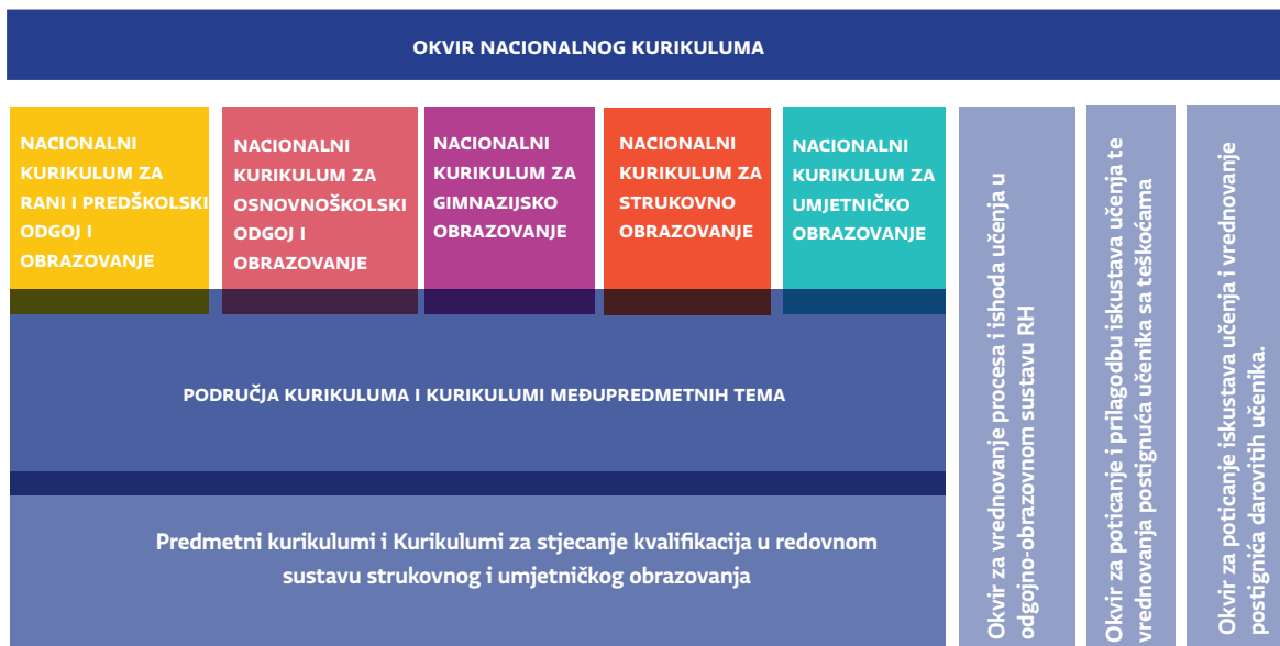
Slika A. Sustav nacionalnih kurikulumskih dokumenata izrađenih u okviru Cjelovite kurikularne reforme

Pred Vama se nalazi prijedlog nacionalnog kurikulumu međupredmetne teme Učiti kako učiti . Okvir nacionalnog kurikulumu (ONK) određuje sustav nacionalnih kurikulumskih dokumenata , kojima se na nacionalnoj razini iskazuju namjere povezane sa svrhom, ciljevima, očekivanjima, ishodima, iskustvima djece i mladih osoba, s organizacijom odgojno-obrazovnog procesa i s vrednovanjem. Međupredmetne teme izrazito su važan dio odgoja i obrazovanja u Republici Hrvatskoj. Sustav nacionalnih kurikulumskih dokumenata prikazan je na Slici A.